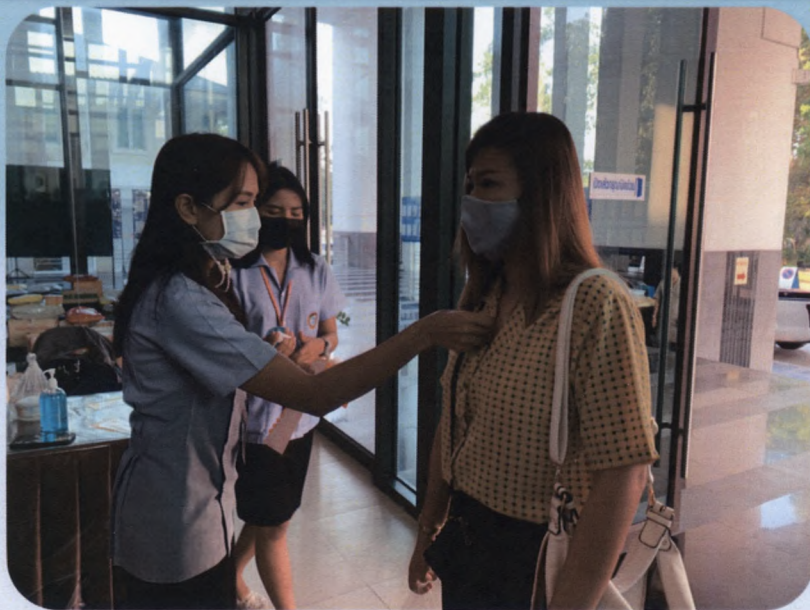
กลุ่มงานสาธารณสุข ฝ่ายพัฒนาสังคม สำนักปลัดองค์การบริหารส่วน