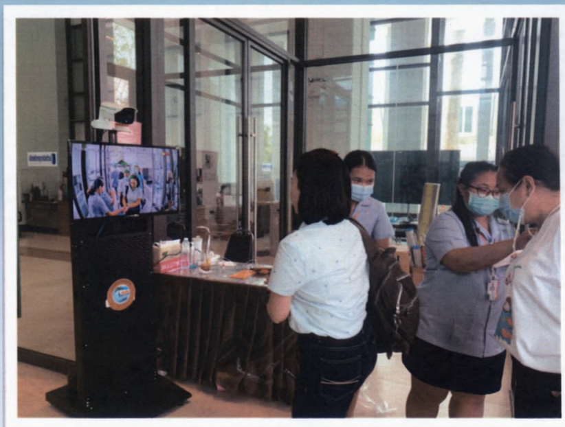
กลุ่มงานสาธารณสุข ฝ่ายพัฒนาสังคม สำนักปลัดองค์การบริหารส่วน