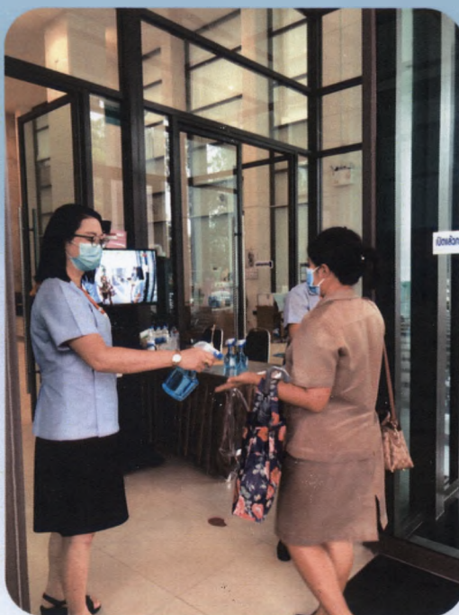
กลุ่มงานสาธารณสุข ฝ่ายพัฒนาสังคม สำนักปลัดองค์การบริหารส่วน