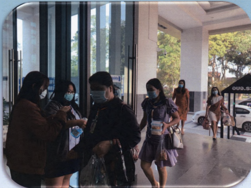
กลุ่มงานสาธารณสุข ฝ่ายพัฒนาสังคม สำนักปลัดองค์การบริหารส่วน